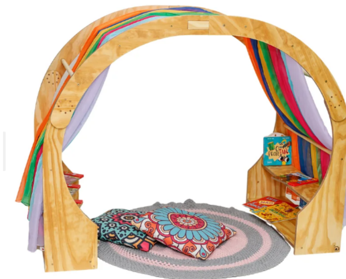
Modelo de referência do item 53, Tenda (cabana) de madeira Waldorf