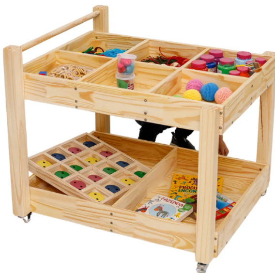
Modelo de referência do item 49, carrinho ateliê de madeira