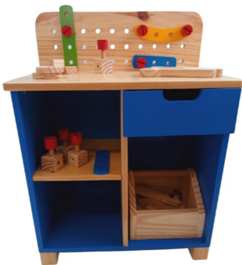
Modelo de referência do item 50, bancada de Ferramentas Infantil