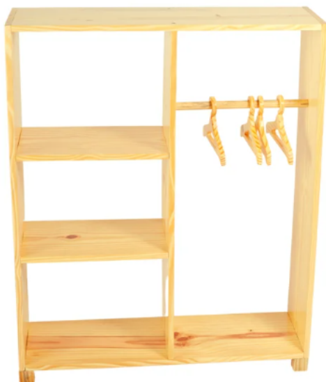
Modelo de referência do item 48, arara Closet Infantil Montessoriano