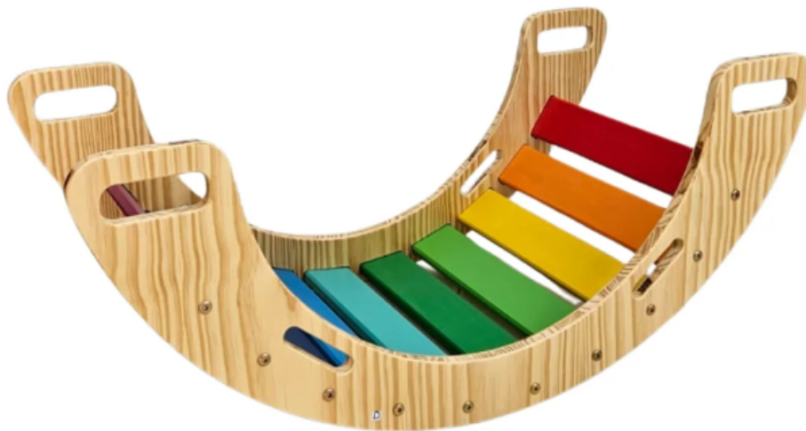
Modelo de referência do item 52, gangorra Pikler Infantil