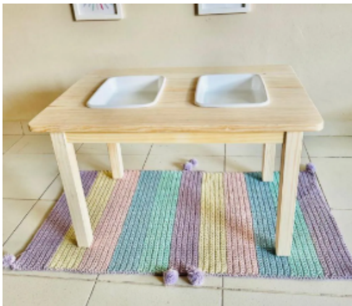
Modelo de referência do item 51, mesa Sensorial de Investigação Montessoriana